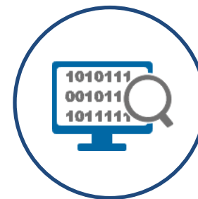
Control de Calidad