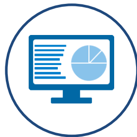
Objetivos & Indicadores