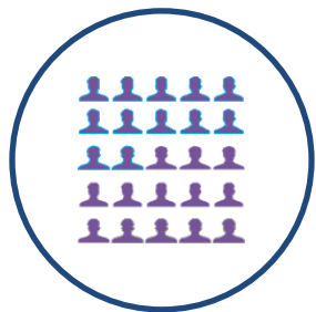
Organización & RRHH

Ven a compartir con nosotros 1 hora de formación ágil y práctica, sobre temas que te ayudarán en la gestión y organización de tu laboratorio, según las normas ISO 17025 e ISO 15189